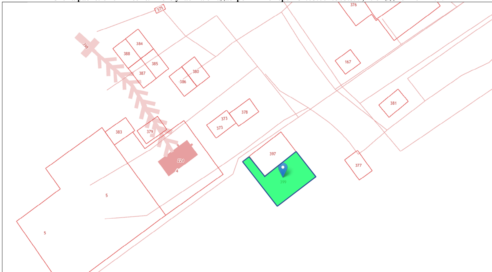
Схема расположения земельного участка с кадастровым номером 84:05:0020305:399, площадью 1764 кв.м.