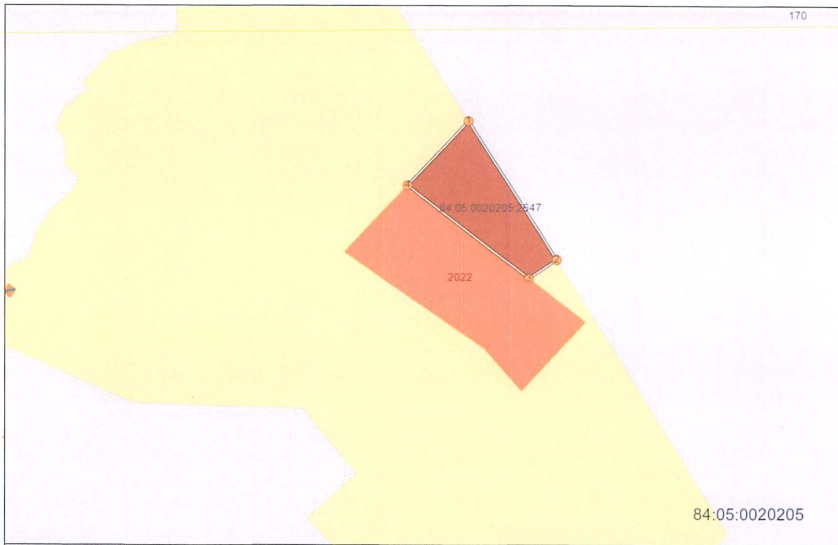
Схема расположения земельного участка с кадастровым номером 84:05:0020205:2647, площадью 9 736 кв.м.